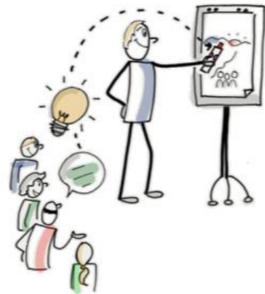
Training "Projekte erfolgreich und agil moderieren und visualisieren"